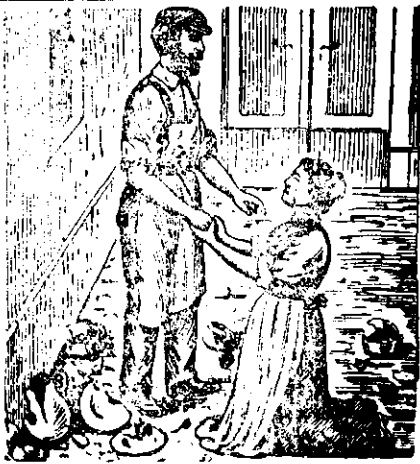
„Maria a căzut în genunchi în fața faurului, i-a sărutat mâinile cu ochii plini de lacrimi, și plângând îngăuna o mulțămă, grăbindu-se spre casă la moica ei fetiță.“

Familia Mariei era foarte săracă. Bărbatul ei se dusese de 4 ani în America și nu i-a mai auzit de veste. Maria se susținea din lu-rul mânilor. Lucra tot lucru greu. Dar pe lângă aceea o mai chinuiau tot felu-