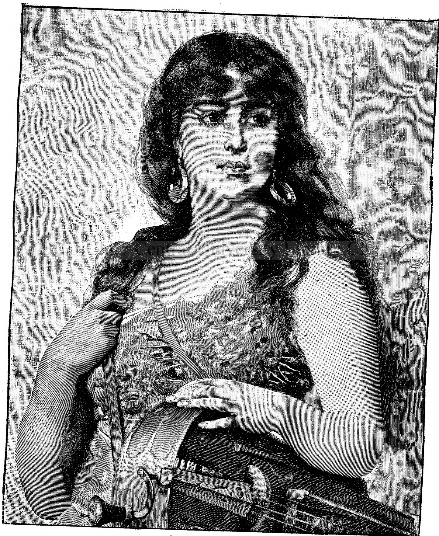
Cântăreță din Savoya.