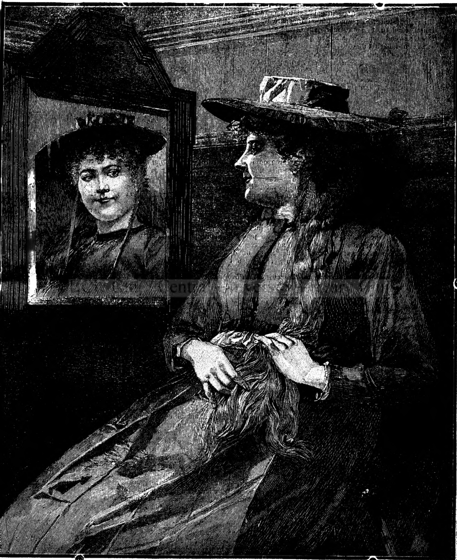
ÂNCĂ O PRIVIRE.