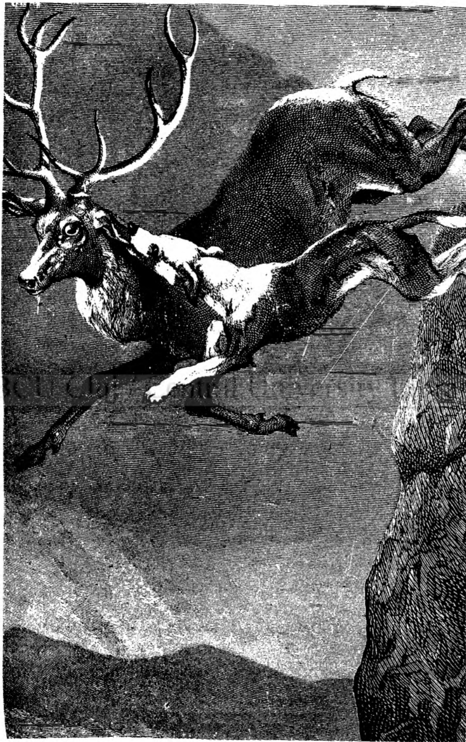
UN SALTO MORTALE.