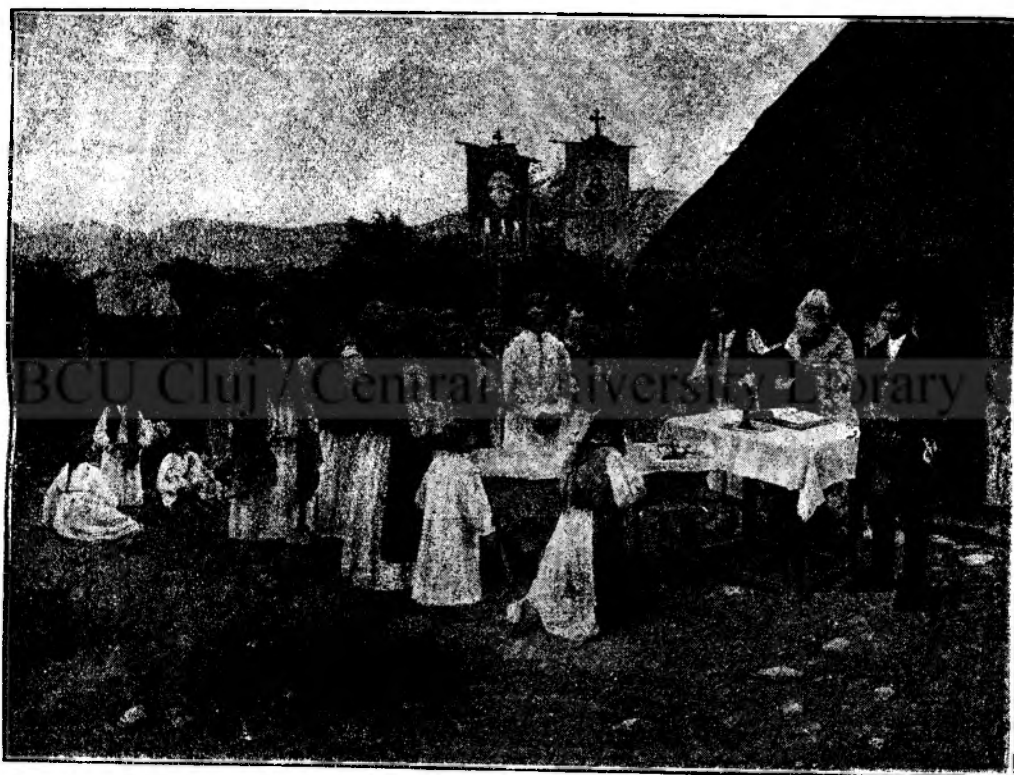
O INMORMENTARE ROMÂNESCĂ.

De poți, deslégă-mi trupul, s'alerg, să cad odată Cu cei ce resbunarea ruşinei lor o cată; Să fiu sdrobot in calte odată cu-al meu ném . . .