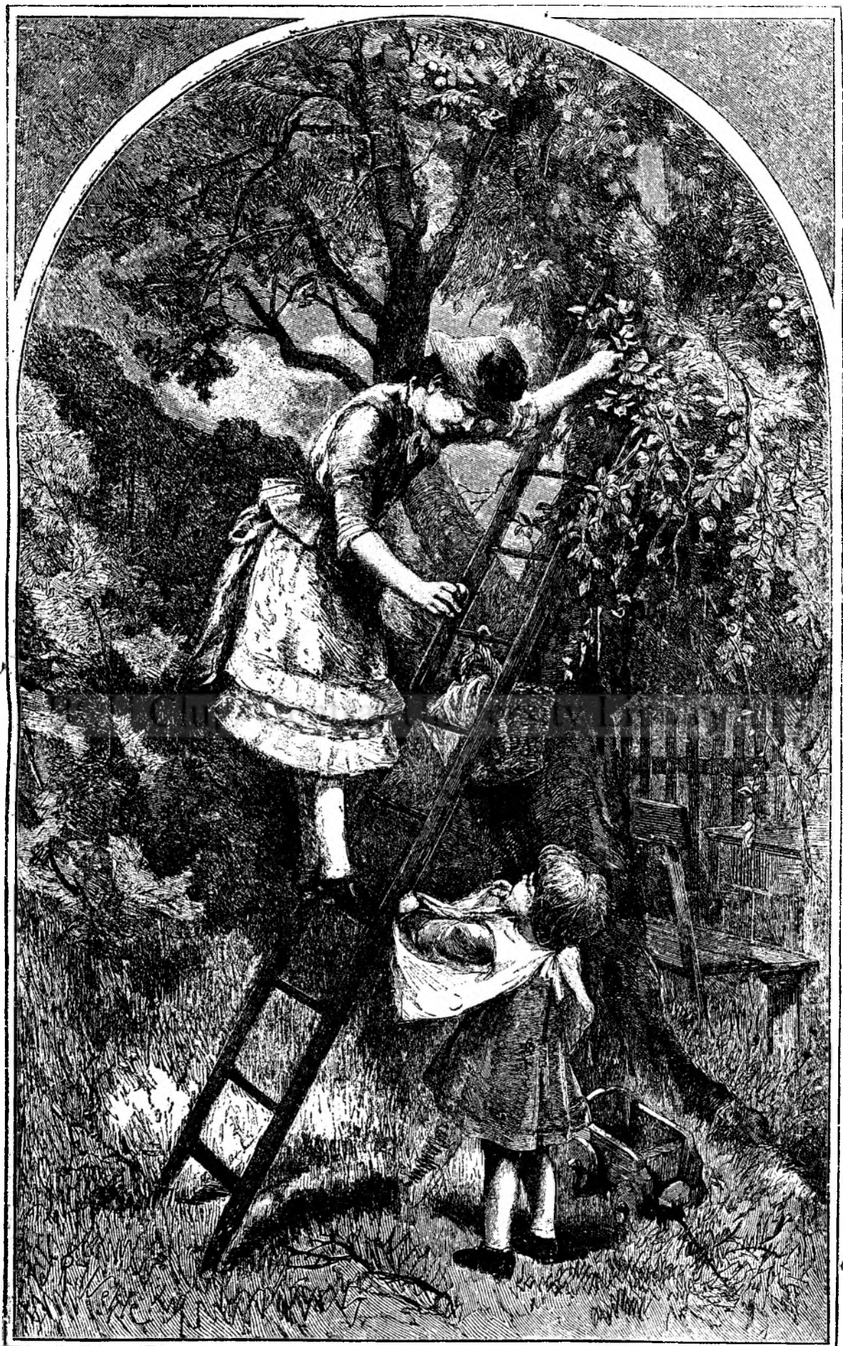
T Ó M N A.