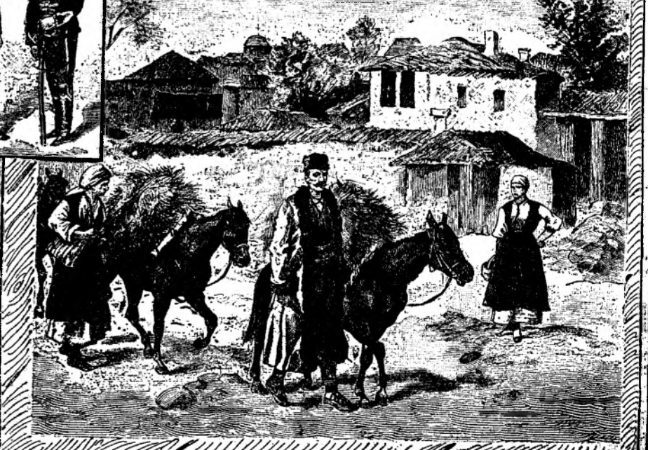
TIPURI DIN SOFIA.