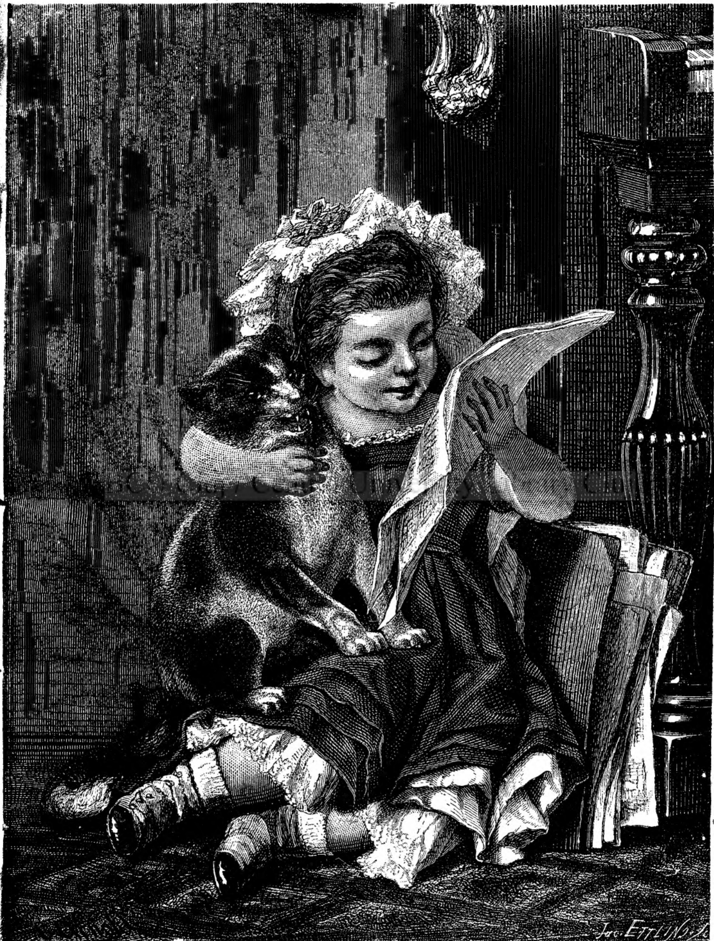
LECTIUNE DE CÂNT.