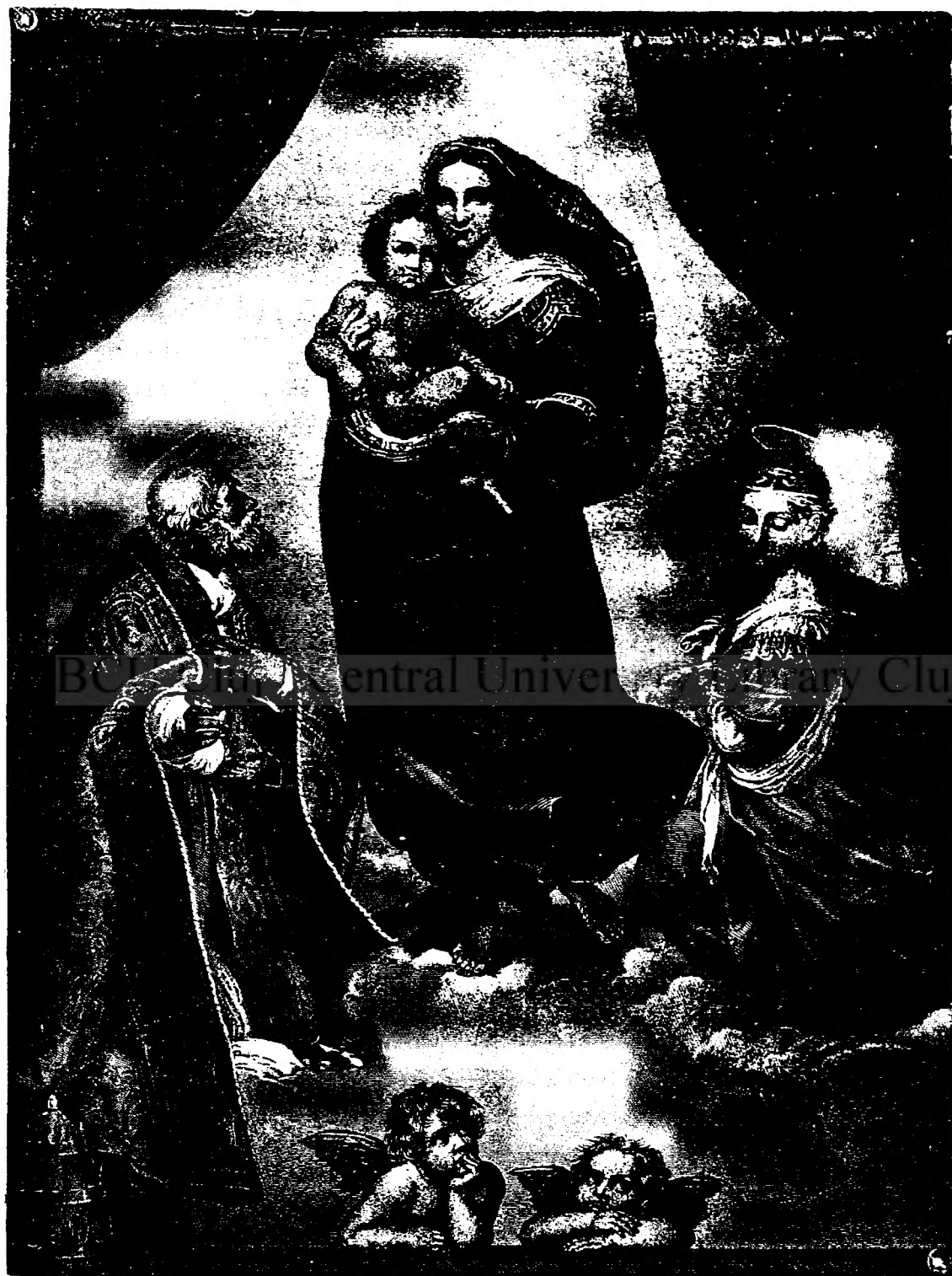
Madonna lui Rafael.