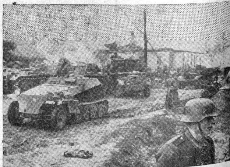
După o luptă, unde bolşevicii au pierdut material de război şi trupe.