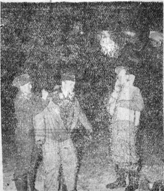
Aviatori germani se pregătesc de sborul de noapte și ajută pilotului să fie cât mai bine îmbrăcat. Avionul e gata de sbor.

Pe uscat se dau lupte în fața orașului Tobruk, în Africa.