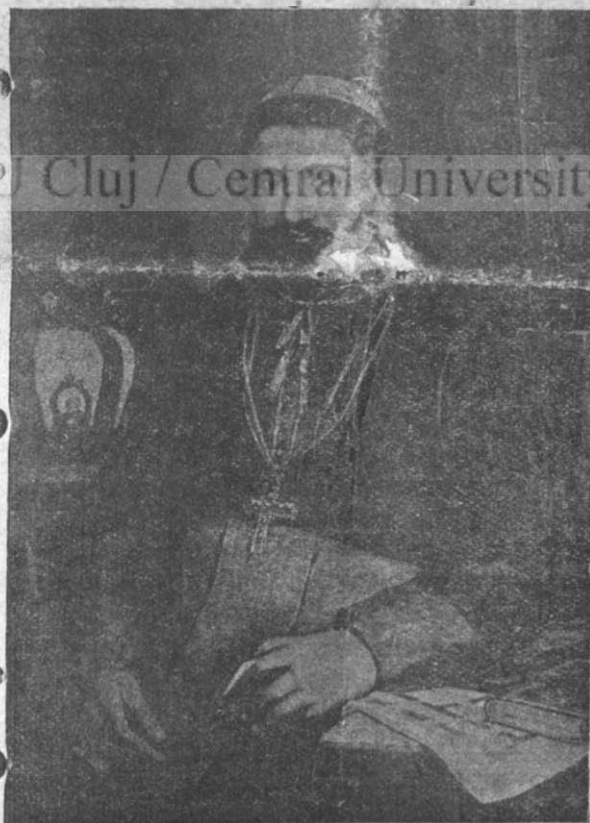
Episcopul Inocențiu Micu

Aici la Roma își ducea viața în lipsuri, într-o chilie sărăcăcioasă, cerșind în rugă cucernice, șoptite printre lacrimi și suspine, îndurarea Domnului pentru urgisitul lui neam. Și, ca să-și