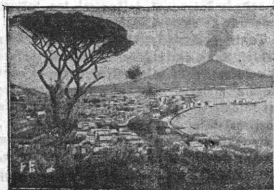
Orașul Neapole din Italia cu vulcanul Vezuviu, care începe să se miște din nou