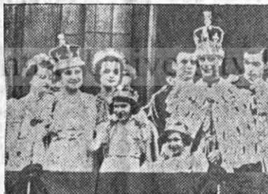
Familia regală engleză

Drumul pe uscat până în Franța s'a făcut repede. În portul francez Boulogne M. S. Regele s'a urcat pe vaporul englez Sikh cu care a trecut marea spre Anglia.