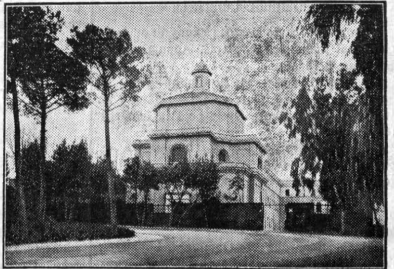
Iată noul seminar românesc dela Roma, binecuvântat și luat în primire la 9 Mai 1937.

Că avem azi la Roma această măreață fundație, vom pomeni numele marelui mitropolit Vasile Suci, care cel dintâi s'a gândit la un seminar românesc în cetatea eternă, cum au toate națiile pământului, chiar și rutenii. Și încă din anul 1921 a trimis la Sf. Scaun o cerere și o propunere în acest scop. Gândul mitropolitului Vasile Suci a găsit la Roma inimi aprinse de dragoste părintească. Incă Preafericitul Papa Benedict al XV-lea a întemeiat un fond de 2 milioane lire pentru seminarul românesc. Iar urmașul