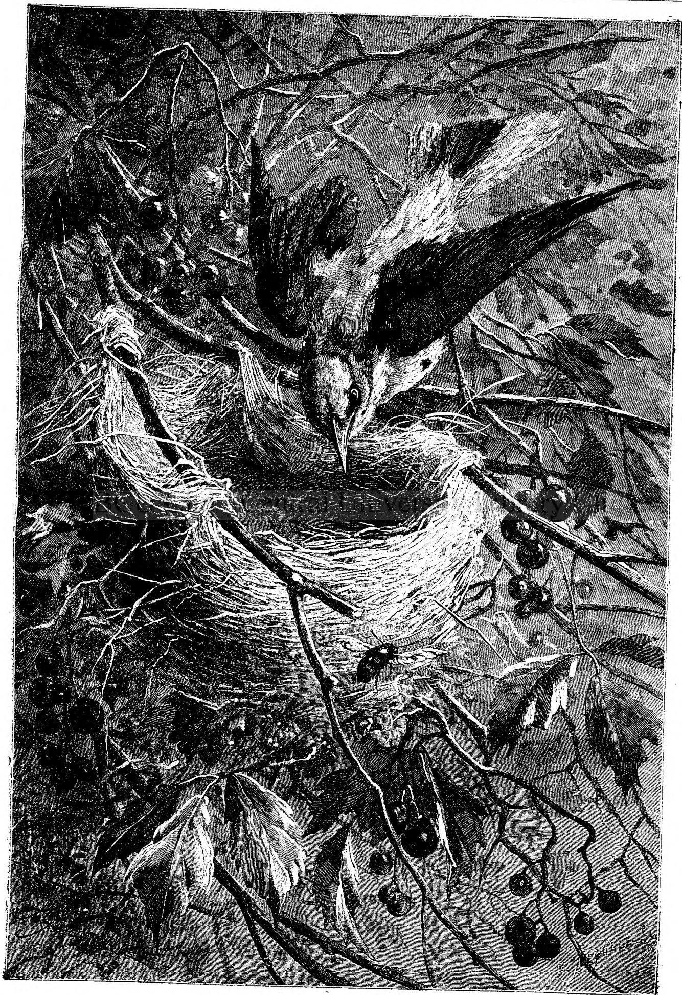
CUIB DE PASERE.