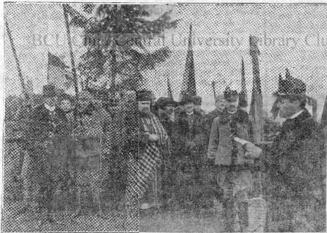
Vedere dela adunarea din 1 Decemvrie 1918, când s'a hotărât unirea pe veci cu Patria-Mamă

Dar atunci când cineva îți calcă în picioare un drept sfânt, nu ajunge numai atât ca să-i arăți că se găsește pe drum greșit. Acest lucru e cel dintâi și e bine