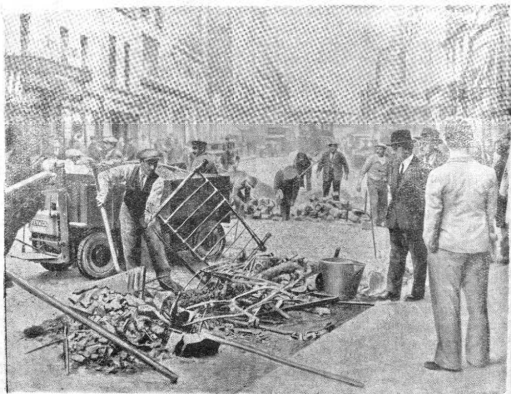
La Paris 1 Mai, sărbătoarea muncitorilor, n'a decurs în liniște. Muncitorii s'au ascuns după baricade, împușcând înspre soldați și polițiști. Au fost mai mulți răniți și de o parte și de alta. Ruinele de a doua zi le adună și le încarcă în autocamioane.