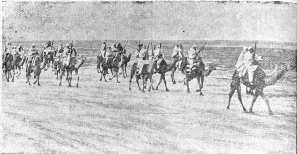
Călăreții vahabiți pleacă, încăleacănd pe cămile, în războiul contra Yemeniților. Amândouă aceste sămânții sunt înrudite una cu alta, ținându-se de neamul Arabilor.