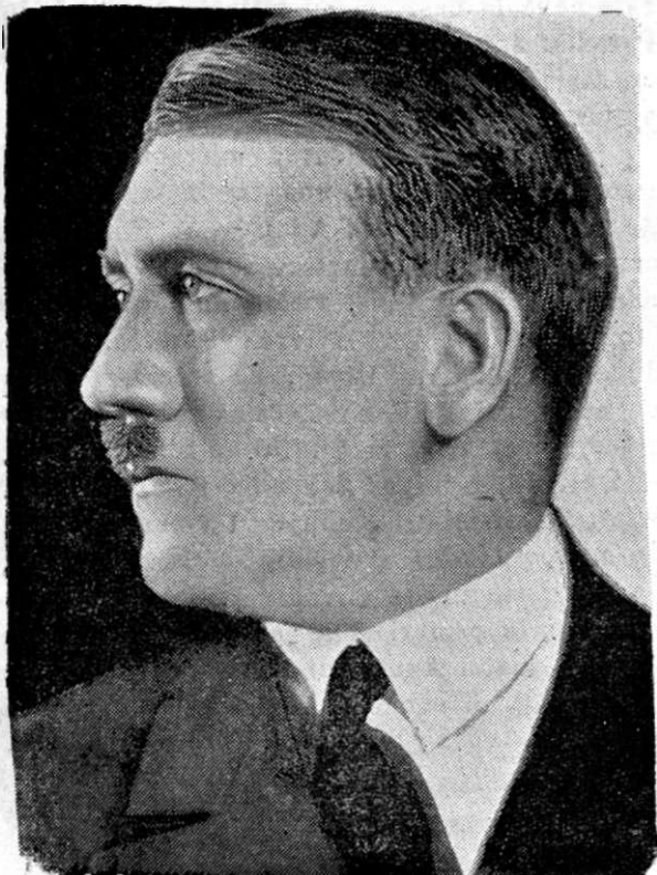
Dăm aici fotografia ministrului președinte al Germaniei, după cea mai nouă a sa fotografie.