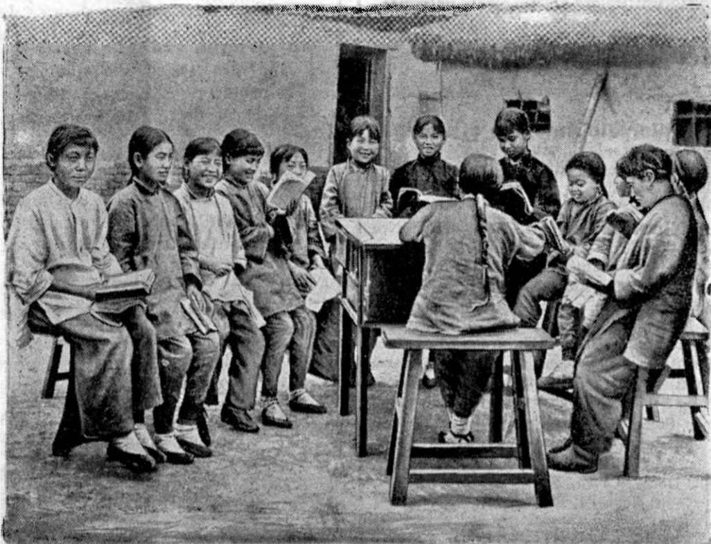
Misionarii catolici din orașul Nanking din China au înființat mai multe școli. Dăm aici fotografia unei astfel de școli, în care învață numai copile.