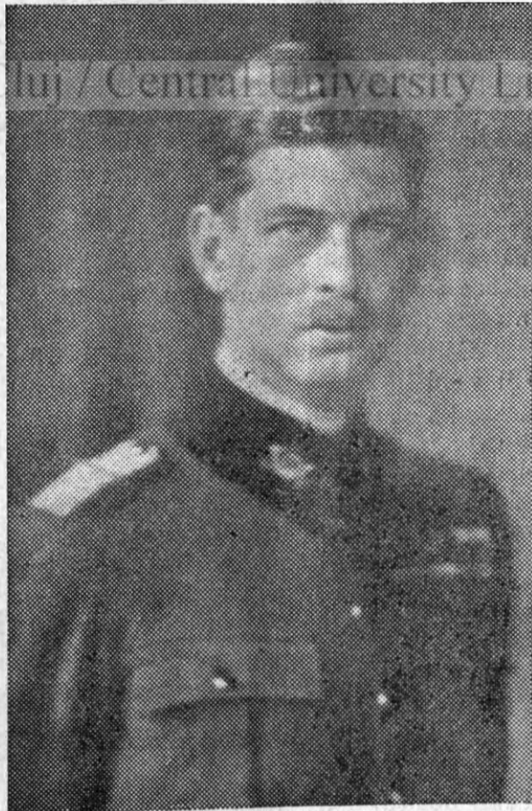
M. S. REGELE CAROL II, sărbătorit de țara întreagă la un an dela urcarea Sa pe Tron

Sunt și azi fruntași și codași pe sate, cum sunt și în orașe și în toată lumea. Cât vor fi oamenii pe pământ deplină egalitate nu va putea fi între oameni, fiindcă din naștere se deosebește om de