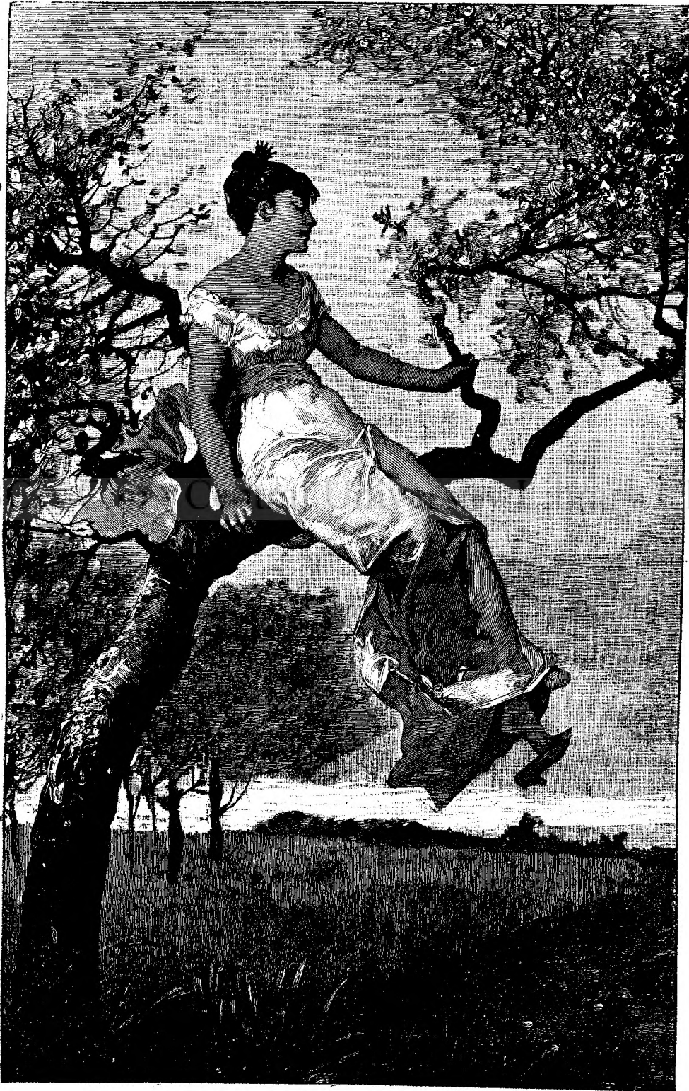
Pe crenga de măr.