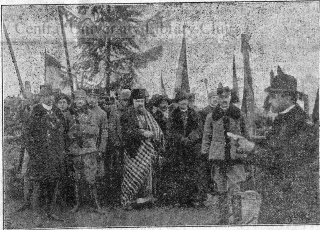
Vedere dela Alba-Iulia din 1 Decembrie 1918. P. Sf. Sa Episcopul Iuliu Hossu citește în fața poporului hotărîrea alipirii Ardealului la Patria-mamă

Iar războiul cel mare făcut-a din Alba-Iulia temniță largă pentru vizitorii neamului nostru, cari chemau în gând oștile odihnite ale urmașilor lui