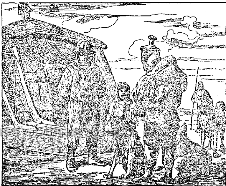
Am cetit cu toții despre întâmplarea nenorocită a generalului Nobile, care, vrând să sboare, cu mai mulți tovarăși, peste Polul Nordic, a căzut între ghețurile veșnice. Chipul nostru arată cum trăiesc oamenii în ținuturile dela Miazănoapte.