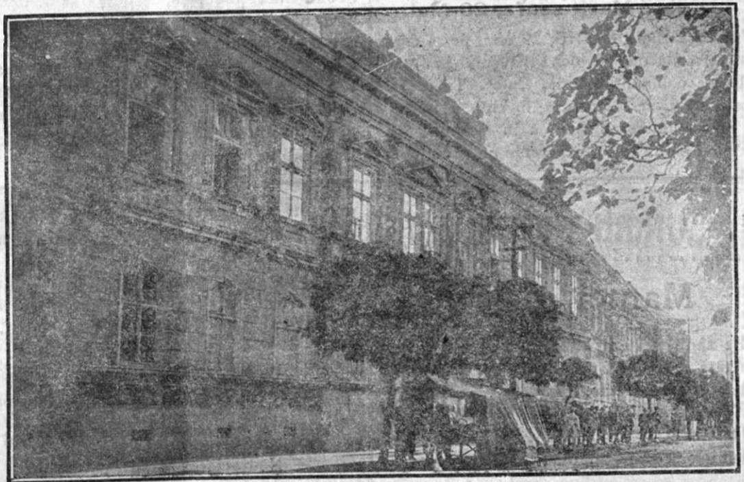
Liceul „Samuil Vulcan“ din Beiuș

Alduită de Dumnezeu a fost în deosebi clipa, când, în scaunul episcopesc dela Oradea mare, urcă marele fiu al