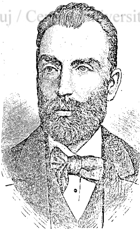
Alexandru Papiu Ilarianu (1827—1879).

La acest strigăt iobăgimea se propti în fața armelor ca un zid de aramă, iar cătanele nemeșești au coborît armele cu