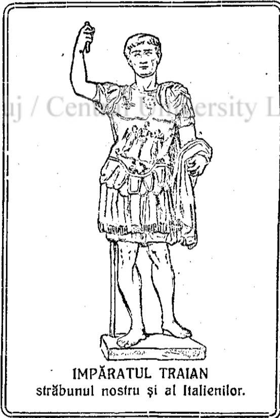
IMPĂRATUL TRAIAN străbunul nostru și al Italienilor.

să-l cinstească pe marele nostru învățat cu o amintire foarte prețioasă. I-au dat un sigil universitar, în care este săpat chipul Minervei, zeița științei, cu po-doabele fasciei naționale italiene.