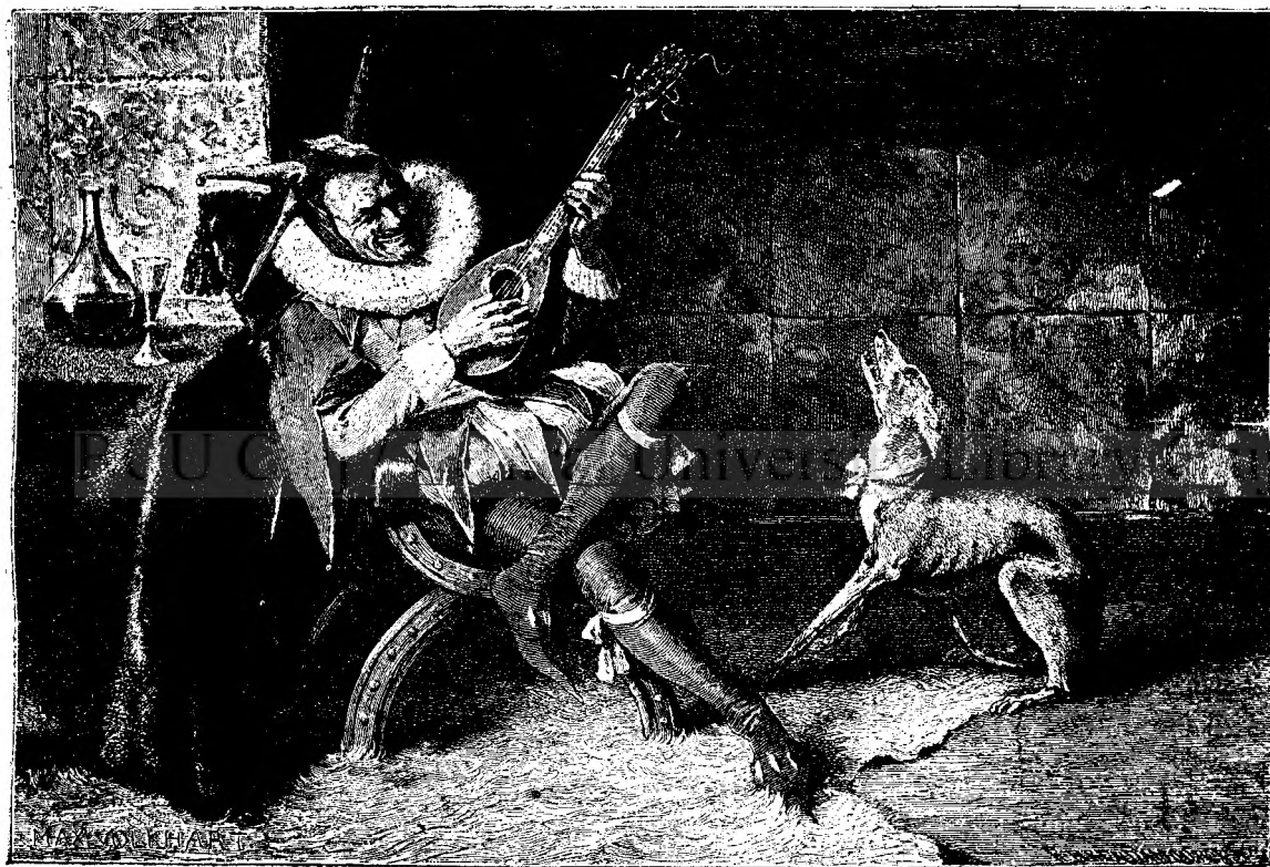
Nebunul curții își petrece.

Intr'o carte a unui autor român intitulată: „Ade-