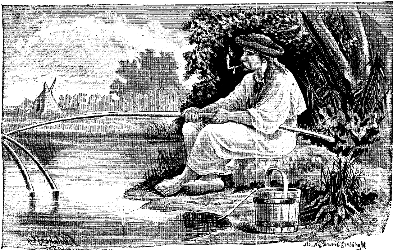
Pescariul dela Tisa.

Dar din o cupã iute se făcurã douë și așã mai departe. Studenții aveau voie, ceialalți óșpeți asemenea.