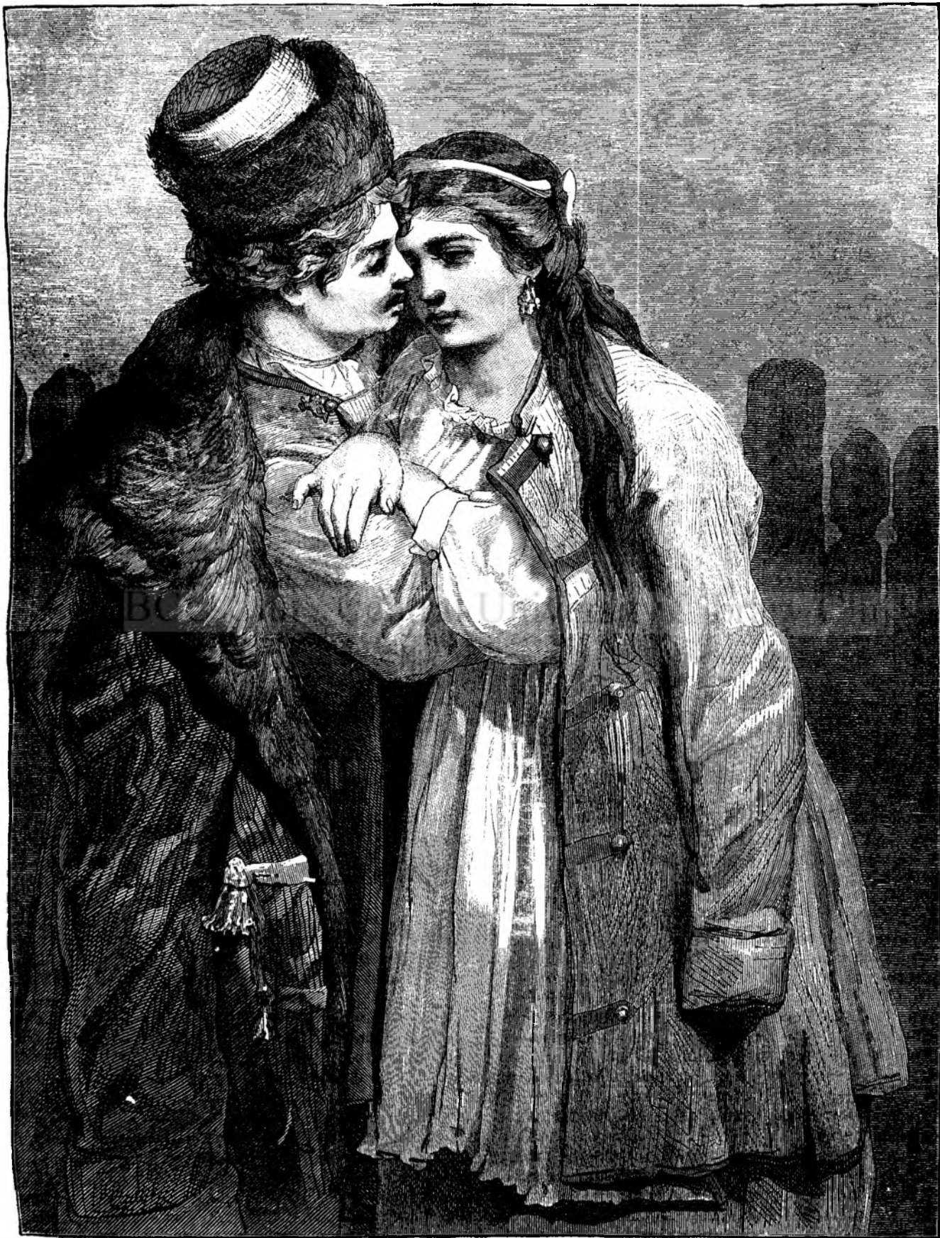
Logodiți din Rusia mică.