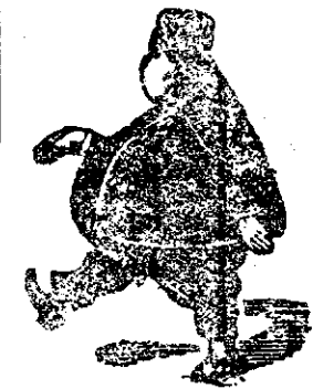
s'a îngrășat de 120 Kigr.