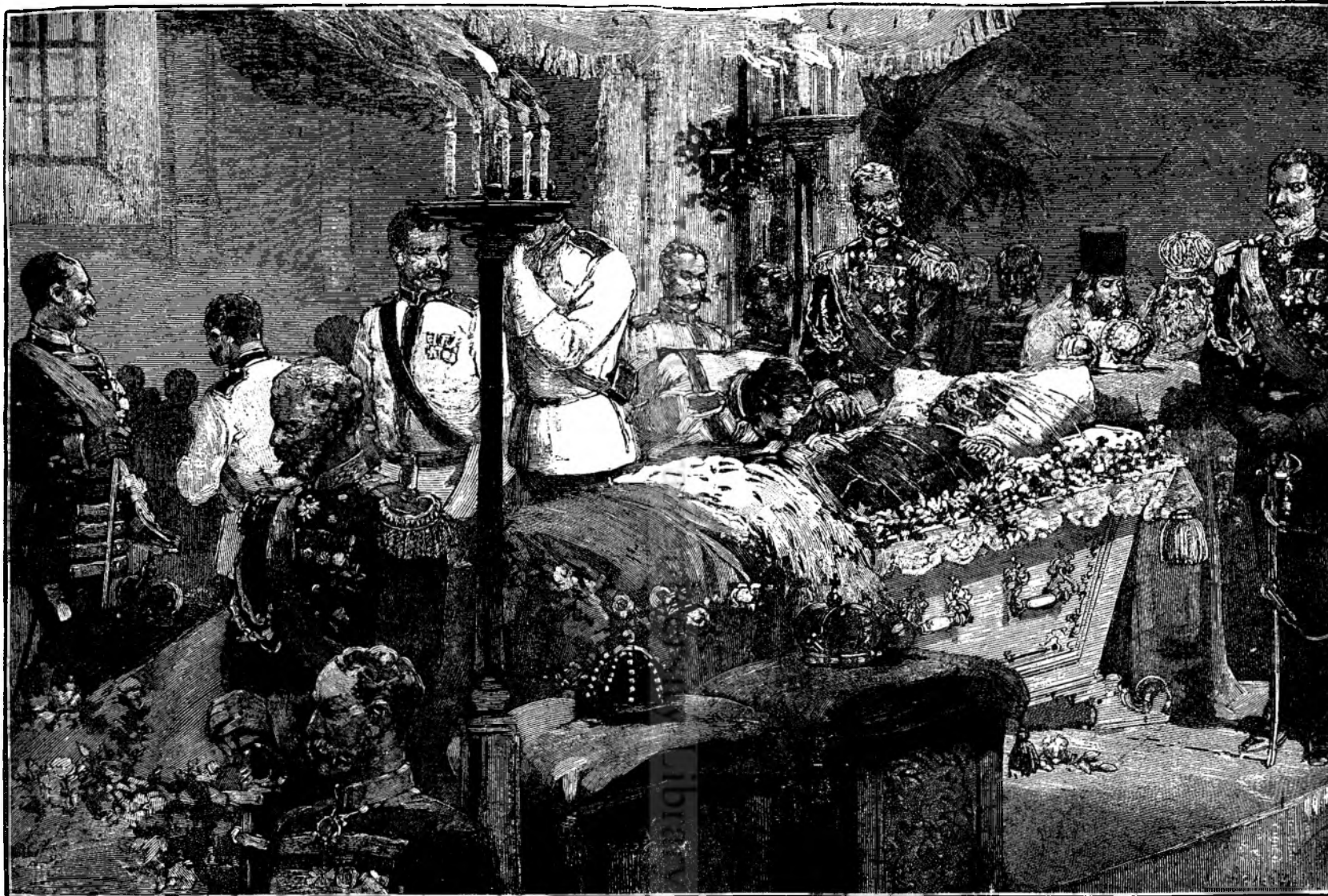
Țarul Alesandru II pé catafalc. (Sarutarea de mâna.)