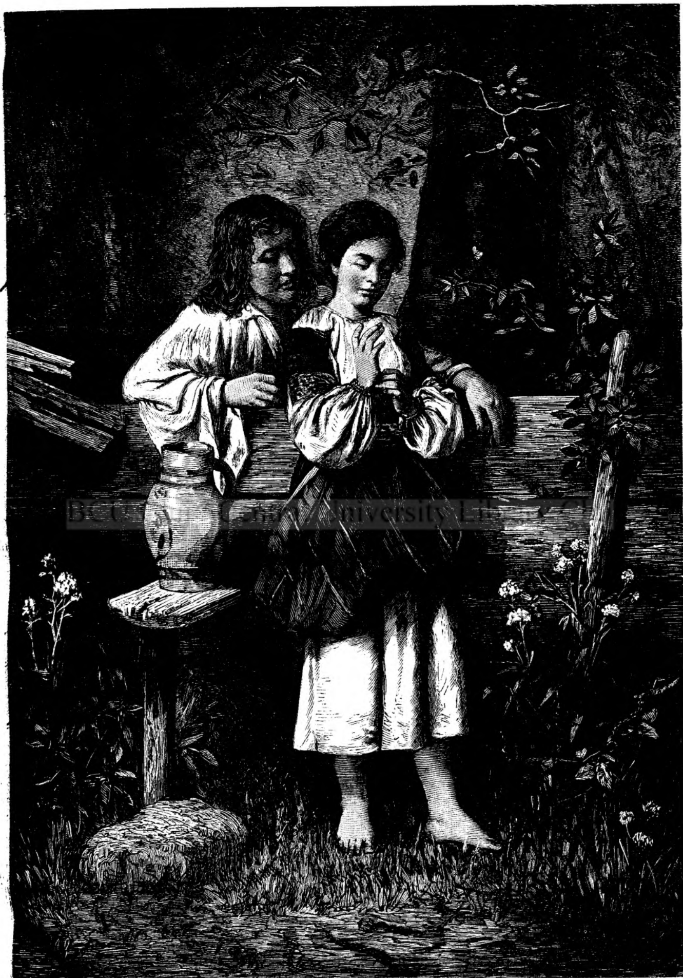
„En asculta !“ (Dupa originalul de Epaminonda Bucewsky.)