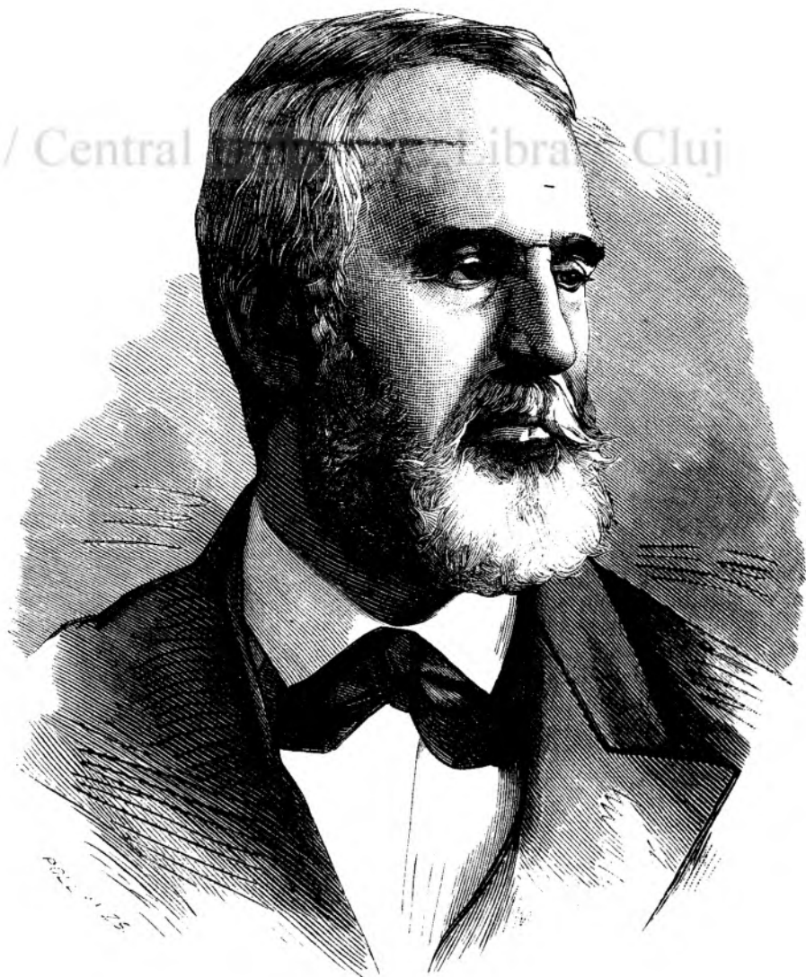
Aleco pașia, guvernatorul Rumeliei orientale.

— Déca voiesci sè remâni în casele aste, îti oferu o odaia.