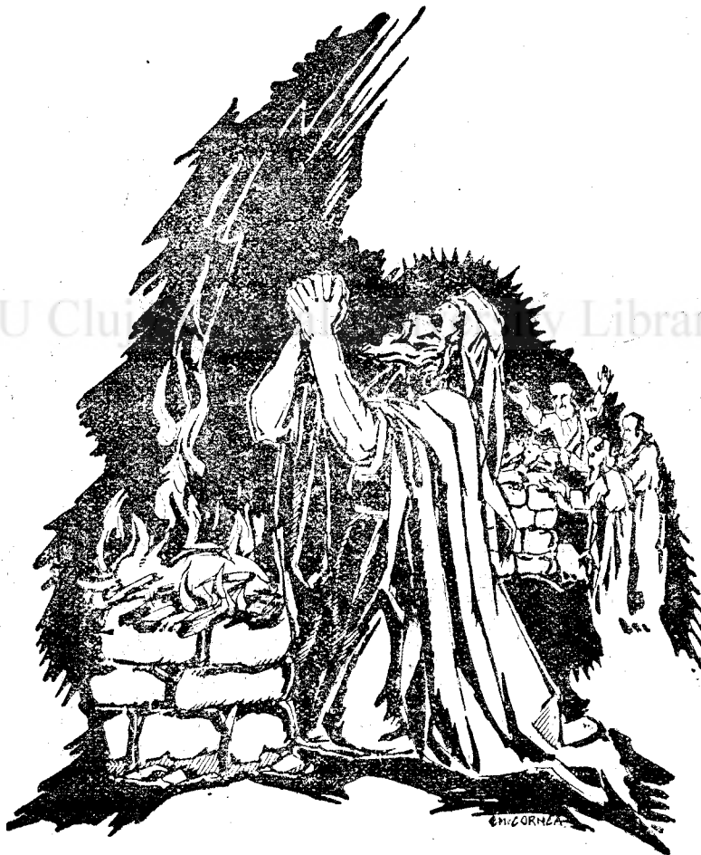
Fericiți sunt cei ce cred și sperază..

ciocși, sunt de puțin folos în lume și pentru ei înșiși și pentru alții.