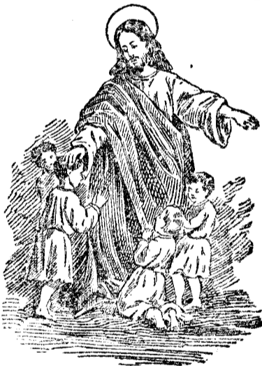
Domnul cheamă copiii la El