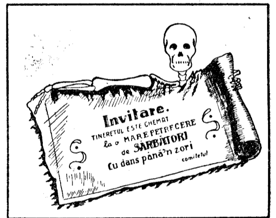
Diavolul îi cheamă și el