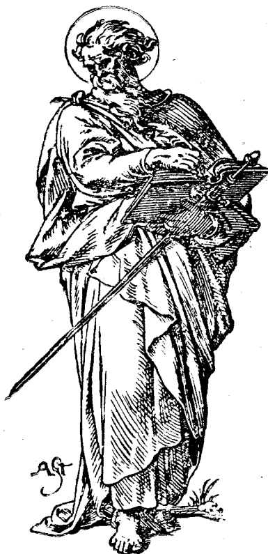
Sf. Apostol Pavel

În cele ce au premers încercând să tâlcuim cele zece versete din cap. 20 al Apocalipsei sf. Ioan, versete de care unii sectari s'au legat, ajungând la păreri dăunătoare Bisericii și Neamurilor în mijlocul cărora au propovăduit, nădăduiesc că s'a făcut o oarecare lumină, care numai sănătoasă poate fi. Sănătoasă pentru suflet și de folos pentru obște. Căci nu-i tot una să trăiești cu frica în sân că ba azi, ba mâine, sorocul mă poate paște și eu nu știu dacă sunt sau nu sunt pregătit, sau să stai liniștit, muncind cu tra-