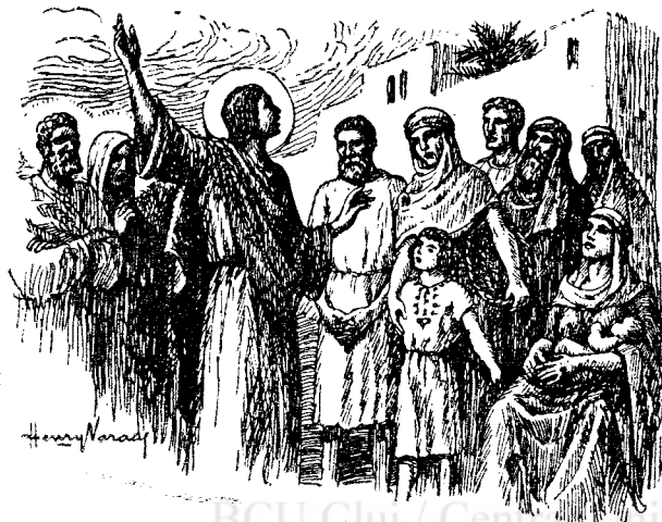
Iisus predică mulțimei

În afară de cele amintite, ce învață oare Martorii lui Iehova? Cum s'a mai amintit într'un răvaș din numerile trecute ale gazetei noastre, după pastorul Russel, lumea se împarte în trei mari veacuri. Cea dintâi