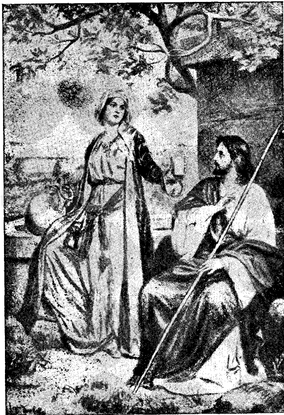
Iisus și Samarineanca

Adăparea din isvorul apei celei vie aduce veșnica primă-