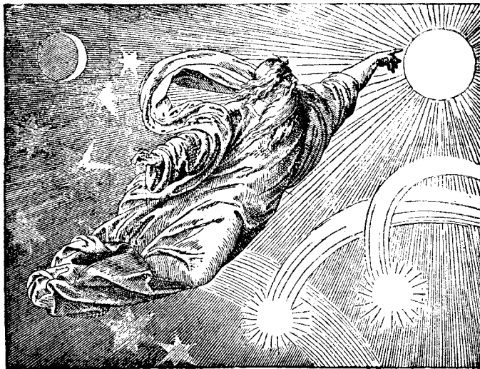
Cel ce a făcut cerul și pământul

Din înțelepciunea altora luăm miezul cel