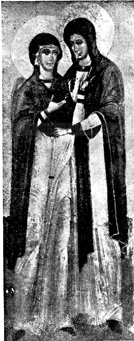
Cele două Marii

ca martori apropiați ai patimilor. Sufletul femeesc, este dela Domnul lăsat să fie cu mlădiere deosebită și cu aleasă în-