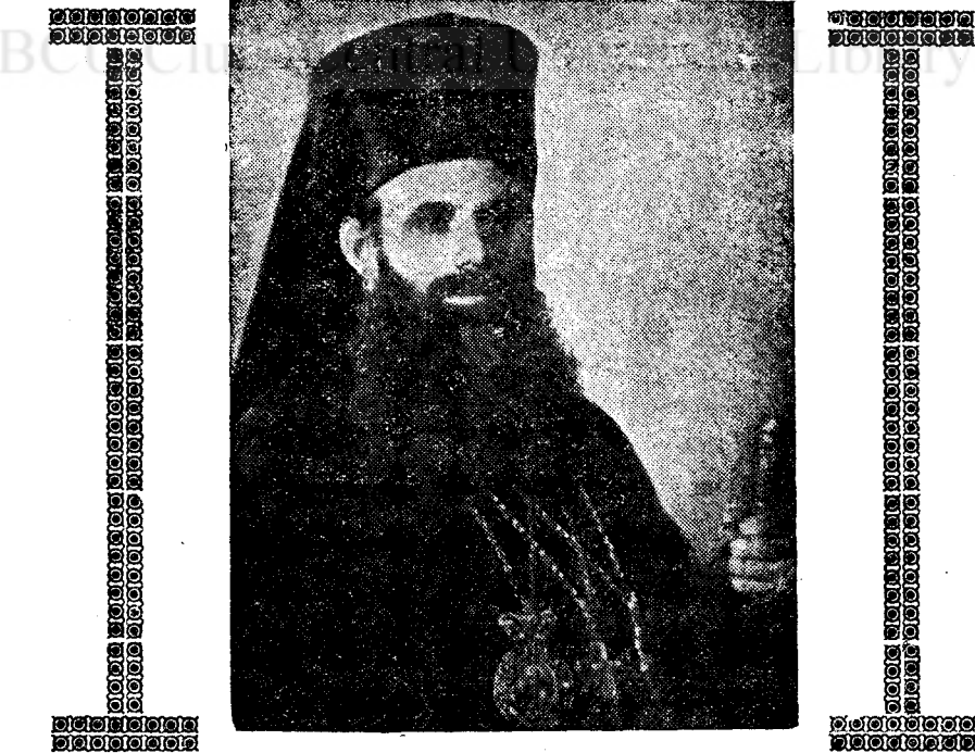
I. P. S. Patriarhul Iustinian

Greutățile pe cari le-am avut de întâmpinat, în actul unificării, nu se datorează câtuși de puțin faptului că poporul ar fi fost strein de gândul de-a reveni la Biserica străbună. Necazul însă era, că multe sate, în deosebi pe Câmpie, nu aveau preoți. Păstorii sufletești, a căror datorie era să rămână lângă turmele cuvântătoare, îmbătați cu apă rece și mai catolici decât papa, o luaseră razna. Alții, lepădând rasa preotească și închipuindu-și că săvârșesc te miri ce act eroic, priveau nepăsători când morții din satul în care au deținut