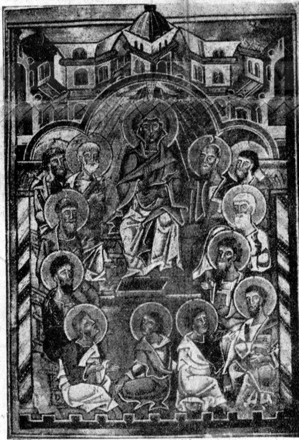
Pogorârea Duhului Sfânt

alte limbi, cum le dădea Duhul să vestească. Și se aflau atunci în Ieru- salem, Iudei, oameni cucernici din toate neamurile de sub cer. Iar când s'a făcut sunetul acesta, s'a adunat mulțimea și s'a umplut de nedume- rire, că-i auzia fiecare grăind în limba sa. Și se mirau toți și se minunau zicând unul către altul: aceștia cari grăesc nu sunt ei oare toți Galileeni? Parții, midenii și elamitenii, locuitorii Mesopotamiei, ai Iudeii, ai Capado- chiei, ai Pontului și al Asiei, ai Fri- giei, ai Pamfiliei, ai Egiptului și ai ținuturilor Libiei, celei de lângă Ci- rena, Iudeii și prozelitii veniți dela Roma, Criterii și Arabii, îi auzim grăind măririle lui Dumnezeu în limbile noastre“ (Fapt. Ap. 2, 11-1).