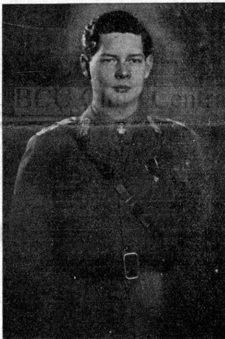
M. S. Regele MIHAI I.

Dacă Regele Carol I ne-a dat Regatul și Regele Ferdinand I România Mare; atunci M. S. Regele Mihai I — purtătorul numelui lui Mihai Viteazul unificatorul Românilor — concentrează și evocă mai puternic toată nădejdea unei istorii ce se vrea pentru totdeauna realizată. Toată suflarea românească, ori unde s'ar afla, poartă în suflet icoana Regelui, încadrată în focul dragostei curate. Este aceasta o lucrare sufletească avea să fie nădejdea unui neam greu încercat în cursul veacurilor, ci un act al Providenței divine menit să fie în zilele de restriște, un sprijin neîndoielnic al dreptății.