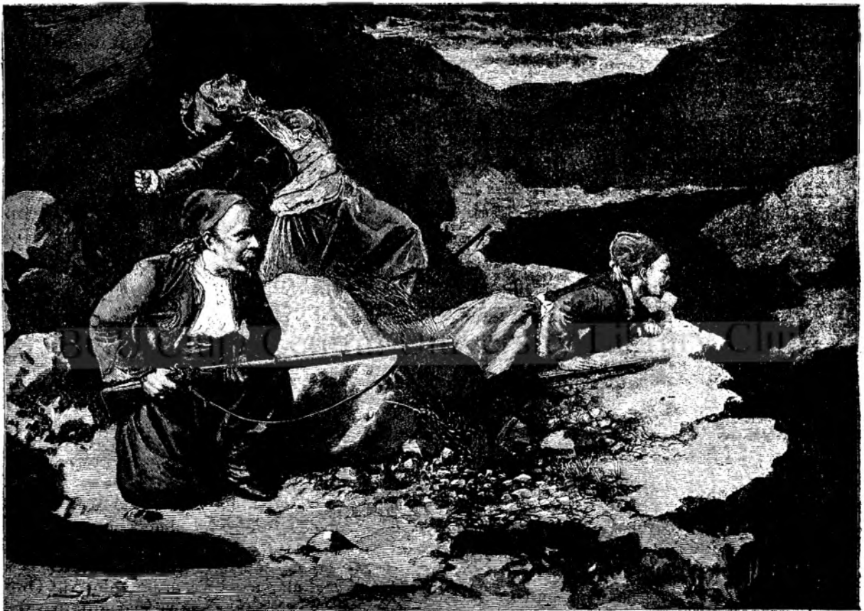
Resculati greci la pânda.