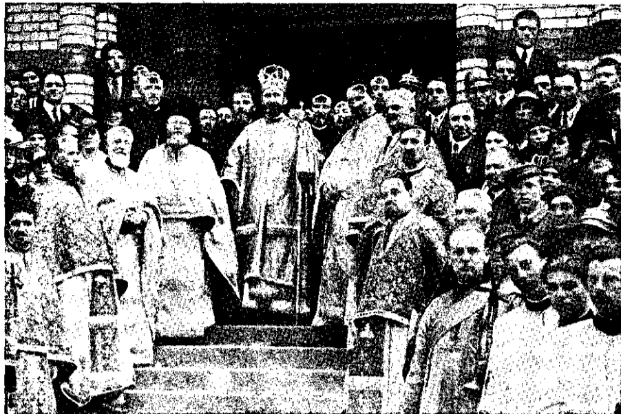
P. S. Episcop Nicolae Colan după actul sfințirii Sale din Catedrala Sibiului.

Plugarul român nu poate fi decât cu o mare și neclintită credință în Dumnezeu. — Cerul și pământul; ciripitul paserilor cari preamăresc pe creatorul și susținătorul lumii înainte de revărsatul zorilor, când pornește el la muncă; răsăritul marelui soarelui și faptul că Dumnezeu varsă darul său asupra muncii lui ca s'aducă roada la bună vreme; căldura și dogoreala zilei; furtunile și fulgerile; splendidul apus al soarelui și întunericul profund al nopții, fac ca el să se cutremure, să se închine și în sufletul lui să învie, să trăiască și să fie tare credința în Dumnezeu. Această credință vie au avut-o și fericiții părinți ai P. S. Voastre. În ea V'au crescut, cu ea Ați trăit, rugăciunile lor V'au însoțit pe băncile școlii și în pribegia