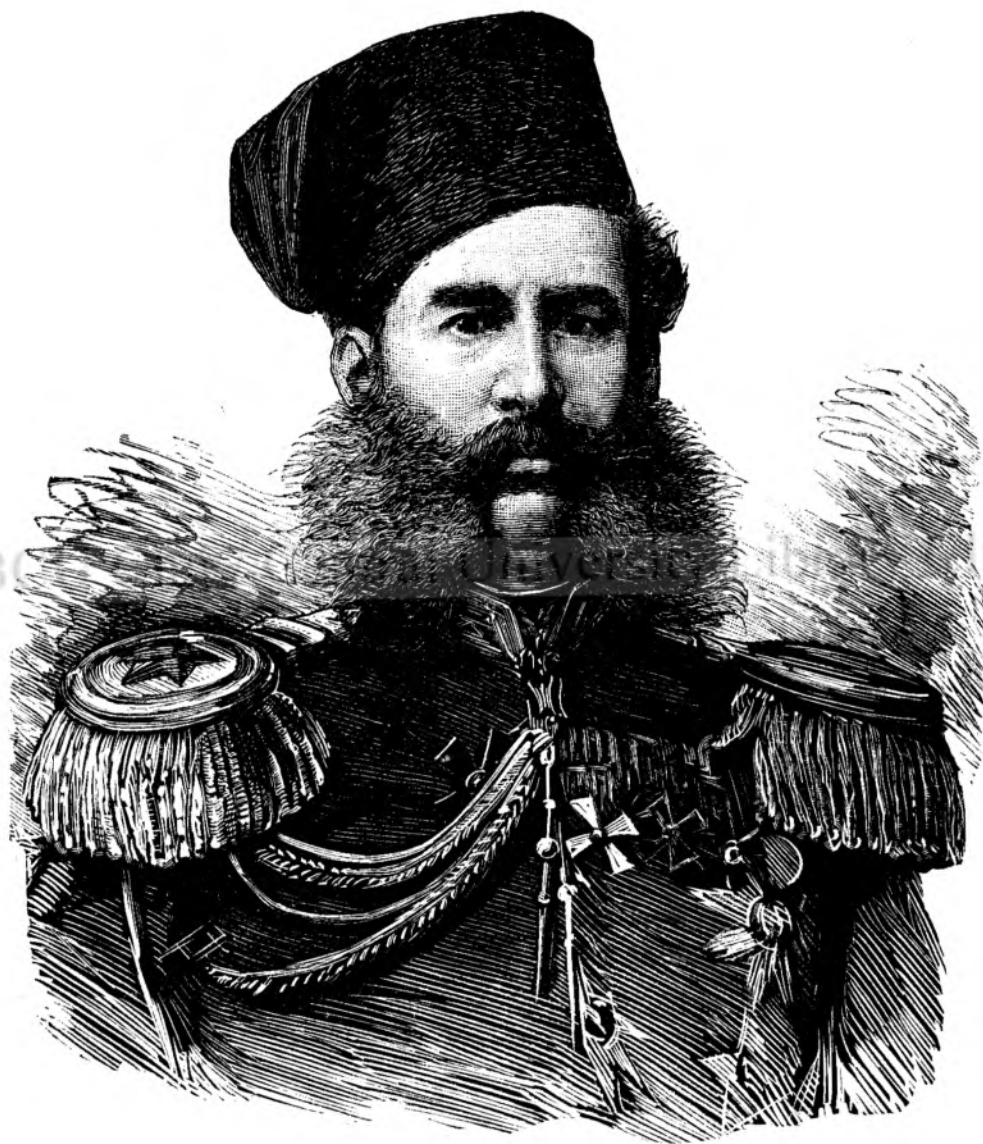
Principele Alesandru Donducoff-Corsacoff, guvernatorulu Bulgariei.

Asiá dara atátu motivulu de a pedepsi pe Români, câtu si amagitu de sperarea de a cuprinde tronulu, atitiá în pieptulu lui Demetriu foculu resbunării, de alta parte nu voiá sè-si piérda reputatiunea la casu când s'ar re-trage cu óstea sa fâra de a încerca nimicu, de