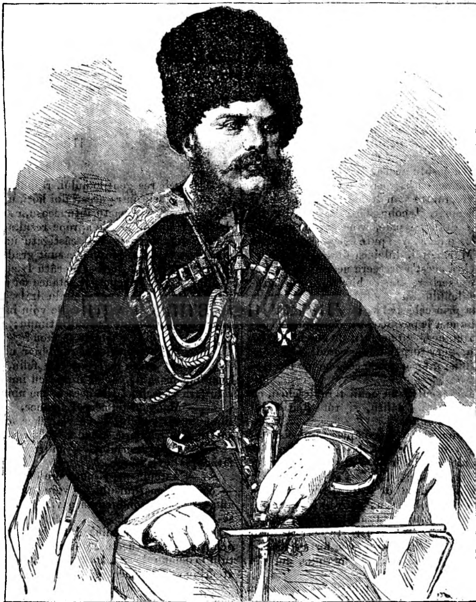
Marele duce Mihailu comandantul șefu alu armatei rusesce în Asia.

— Oh! nu! Așteptu cu conclusiunea, dar voi