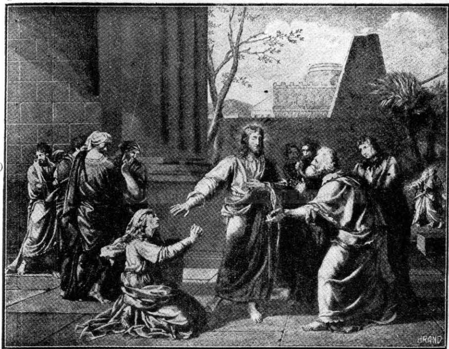
Femeia hananeiană cerând tămăduirea ficei sale (Mateiu cap 15 vers 21—28).