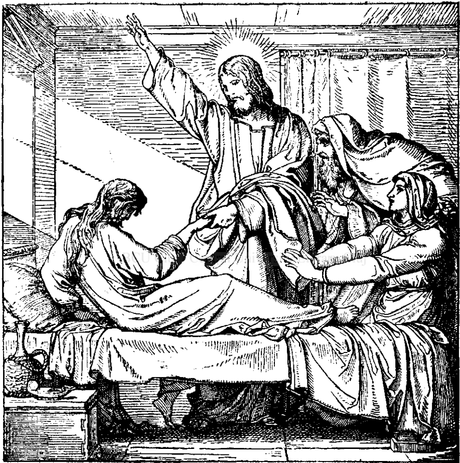
Invierea fiicei lui Iair (Luca cap. 8 vers 41–56).