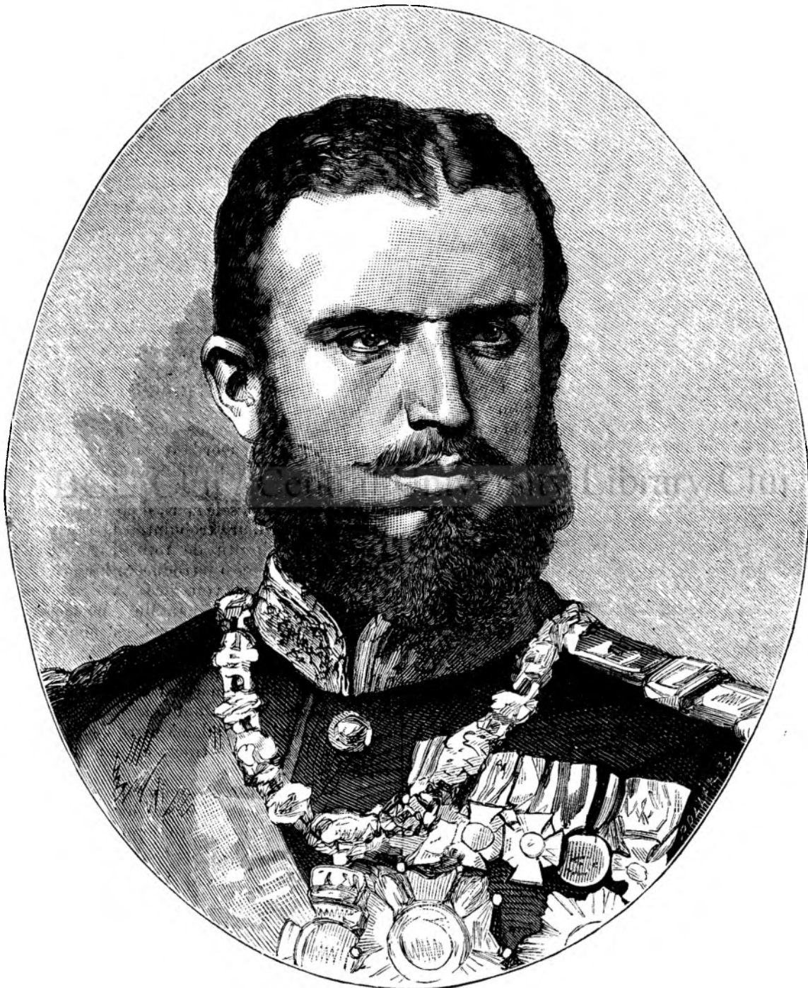
Carol I Domnitorulu Romaniei.

— În momentul, — continuă Olimpia, — cându