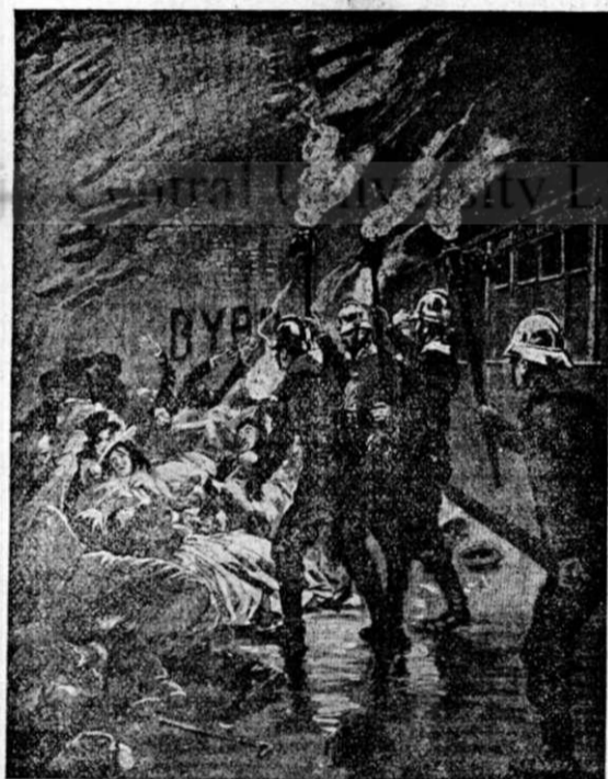
Marea nenorocire din Paris.

Și earăși: cel-ce păzește învățatura bună, pe căile vieții umblă; ear' cel-ce nesocotește muștrarea dreaptă, zăpăcit umblă.