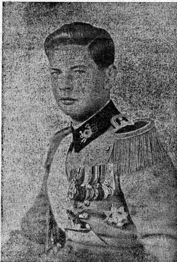
M. S. REGELE MIHAI I