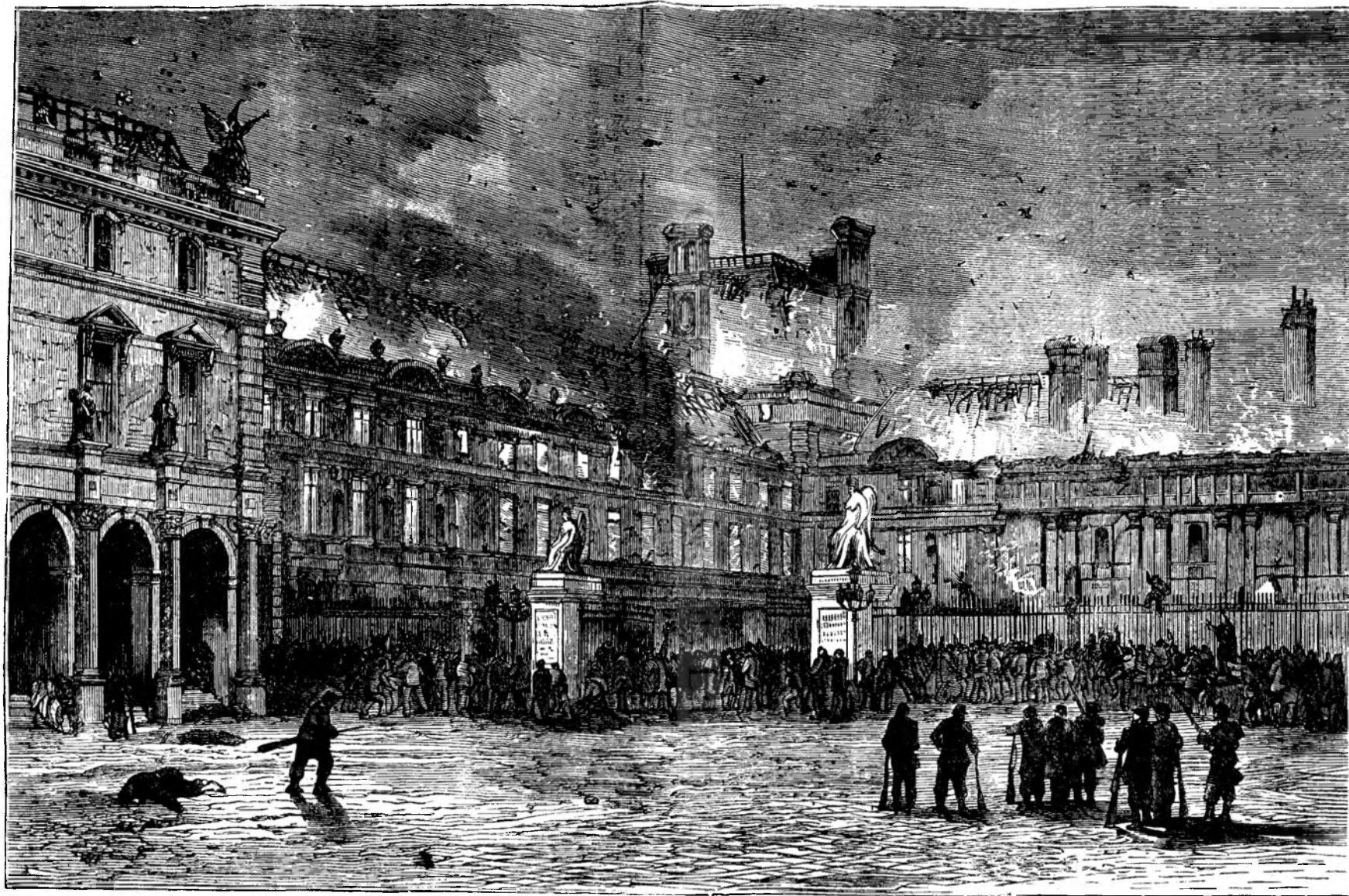
Ruinele palatului Tuilierelor in Paris.